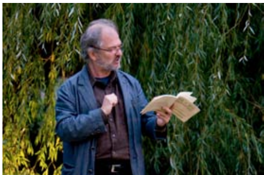
Jacques Rebotier

Ecrivain et poète, Jacques Rebotier est l'auteur d'une quinzaine de livres, parmi lesquels : Litaniques (Gallimard), Sept théâtres impossibles (Harpo &), Le Dos de la langue (Gallimard), 47 Autobiographies (Harpo &), Contre les bêtes (Harpo &), Description de l'homme, encyclopédie (Verticales). Son dernier recueil, 22, placards ! (Aencrages & co ) a reçu le Prix des lycéens Île-de-France au dernier Salon du livre de Paris. Metteur en scène, il fonde la compagnie voQue en 1992 et crée de nombreux spectacles notamment au Théâtre National de Strasbourg, au Théâtre Nanterre-Amandiers, à la Comédie-Française et au Théâtre National de Chaillot. Son travail de poésie orale, porte sur tous les aspects du phrasé, de l'articulation, l'intonation, l'accentuation, le rythme et par là même, rejoint son activité de compositeur.